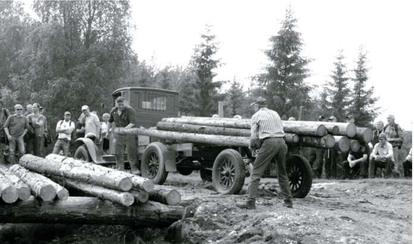
Arne Langnes demonstrerer tømmerbil, en Chevrolet fra 1928 ved åpning av saga. Dette er Norges eldste tømmerbil.