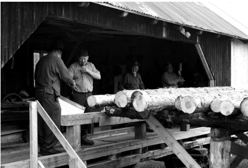
Takk for innsatsen!

Maskinlaget og alle ildsjelene. Uten disse hadde det vært en umulig oppgave å få satt i stand det gamle sagbruket med ny sag og nyoppusset lokomobil igjen. Det har vært interessant å følge prosessen sammen med maskinlaget, en vinn-vinn situasjon for