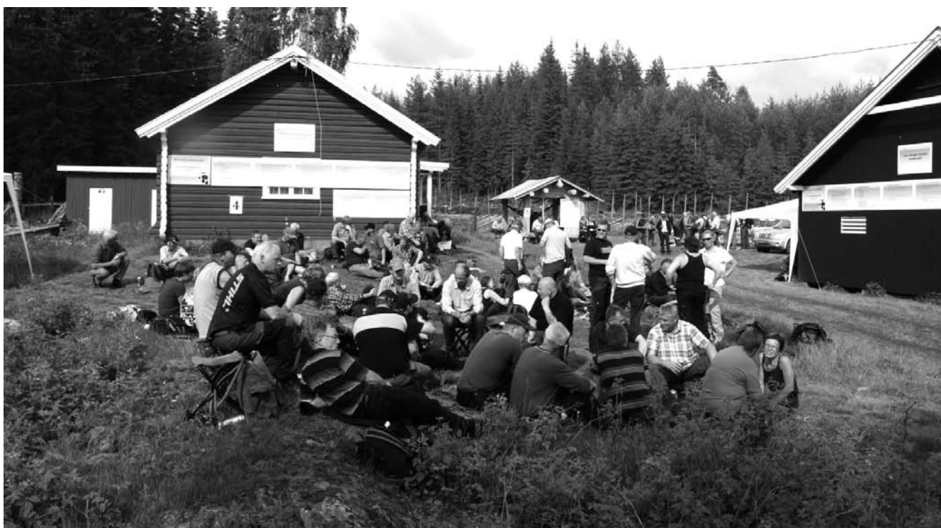
Mye interessant informasjon