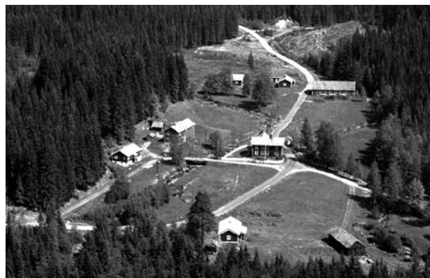
Gammelsaga, tatt før 1980 (Flyfoto)

Vi regner med at mange av dere fikk med innslaget med Maskinlaget fra Gammelsaga på Norge Rundt. De av dere som gikk glipp av seansen kan finne på: Nrk nett-tv